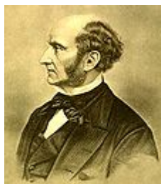
John Stuart Mill (1806 – 1873)

Annar mikilvægur hugsuður á síðari hluta aldarinnar var Friedrich Nietzsche (1844 – 1900). Nietzsche var einnig gagnrýninn á þýska hughyggjumenn sem og á viðtekna siðferðishugmyndir og á trúarbrögðin. [30] Frægasta hugmynd Nietzsches er hugmynd hans um „ofurmennið“, sem hefur sig upp yfir „þrælasiðferðið“ og skilgreinir forsendur eigin tilvistar.