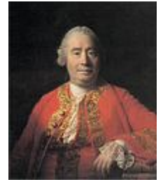
David Hume (1711 – 1776)

Á 17. og 18. öld fór trúarleg heimspeki ekki með stórt hlutverk í togstreitu veraldlegrar heimspeki, enda þótt fræg tilraun Berkeleys til að hrekja kenningar Isaacs Newton sé undantekning. Meðal áhrifamikilla trúarlegra hugsuða þessa tíma voru Blaise Pascal , Joseph Butler og Jonathan Edwards . Meðal annarra mikilvægra höfunda, sem passa ekki í þessi mót, voru Jean-Jacques Rousseau og Edmund Burke . Þessir einstaklingar eru forboði um þá aðgreiningu og sérhæfingu á ólíkum sviðum heimspekinnar sem átti sér stað á tuttugustu öld.