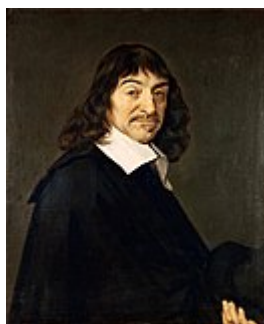
René Descartes (1596 – 1650) er oft nefndur faðir nútímaheimspeki

René Descartes (1596 – 1650), sem oft er nefndur faðir nútímaheimspeki, lagði til að heimspekin byrjaði með róttækri efahyggju um möguleikann á öruggri þekkingu. [21] Árið 1641, í Hugleiðingum um frumspeki , notfærði hann sér þessa aðferðafræðilegu efahyggju með það að markmiði að freista þess að finna traustan grundvöll þekkingar. [22] Hann valdi sem grundvöll heimspeki sinnar hina frægu fullyrðingu cogito ergo sum („ég hugsa, þess vegna er ég“). Síðan reyndi hann að endurbyggja kerfisbundna þekkingu á þessari meintu óvæfengjanlegu staðreynd. Nálgun hans varð þekkt sem rökhyggja og hafði áhrif á heimspekinga eins og Baruch Spinoza , Gottfried Leibniz og Christian Wolff sem voru einnig rökhyggjumenn.