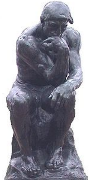
Hugsuðurinn eftir Auguste Rodin

Óformlega getur orðið „heimspeki“ vísað til almennrar heimsmyndar eða tiltekinnar siðferðissannfæringar eða skoðunar .