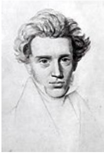
Sören Kierkegaard (1813 – 1855)

Um miðja 20. öld þróaðist tilvistarspekin eða existentialisminn í Evrópu, sem var vinsæl heimspeki með rætur að rekja til 19. aldar í verkum Søren Kierkegaard og Friedrichs Nietzsche. Tilvistarspekin þróaðist einkum í Frakklandi og Þýskalandi . Kierkegaard, sem var danskur heimspekingur og er almennt talinn faðir tilvistarspekinnar, hélt því fram að sannleikur væri huglægur, í þeim skilningi að það sem er mikilvægast lifandi veru eru spurningar er varða innri tengsl hennar við tilvistina. Hlutlægur sannleikur (til dæmis í stærðfræði) er mikilvægur en ótengd hugsun eða athugun getur aldrei fyllilega hent reiður á mannlegri tilvist. Nietzsche hélt því fram að mannleg tilvist væri „viljinn til valds“, þrá eftir fullkonnun eða mikilleika. Framúrskarandi einstaklingar finna upp eigin gildi og skapa