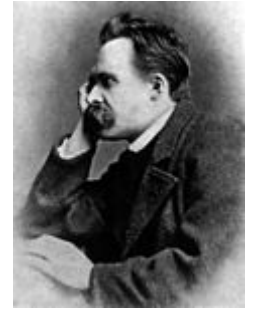
Friedrich Nietzsche (1844 – 1900)

Um miðja 20. öld þróaðist tilvistarspekin eða existentialisminn í Evrópu, sem var vinsæl heimspeki með rætur að rekja til 19. aldar í verkum Søren Kierkegaard og Friedrichs Nietzsche. Tilvistarspekin þróaðist einkum í Frakklandi og Þýskalandi . Kierkegaard, sem var danskur heimspekingur og er almennt talinn faðir tilvistarspekinnar, hélt því fram að sannleikur væri huglægur, í þeim skilningi að það sem er mikilvægast lifandi veru eru spurningar er varða innri tengsl hennar við tilvistina. Hlutlægur sannleikur (til dæmis í stærðfræði) er mikilvægur en ótengd hugsun eða athugun getur aldrei fyllilega hent reiður á mannlegri tilvist. Nietzsche hélt því fram að mannleg tilvist væri „viljinn til valds“, þrá eftir fullkonnun eða mikilleika. Framúrskarandi einstaklingar finna upp eigin gildi og skapa