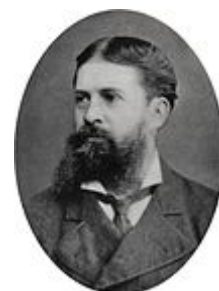
Charles Sanders Peirce (1839 – 1914)

Seint á 19. öld varð til ný heimspæki í nýja heiminum. Charles Sanders Peirce (1839 – 1914) og William James (1842 – 1910) eru taldir frumkvöðlar þeirrar stefnu sem nefnist gagnhyggja [33] (e. pragmatism), sem kynnti til sögunnar það sem síðar nefndist verkhyggja , það er að segja sú hugmynd að það sem sé mikilvægt fyrir góða (vísindalega) kenningu sé gagnsemi hennar en ekki hversu vel hún endurspeglar raunveruleikann. Meðal hugsuða innan þessarar hefðar eru John Dewey , George Santayana og C.I. Lewis . Heimspæklingarnir Henri Bergson og G.E. Moore voru um margt sama sinnis og gagnhyggjumennirnir enda þótt þeir séu venjulega ekki sjálfir taldir til gagnhyggjumanna. Á 20. öld hefur gagnhyggjan átt málsvara á borð við Richard Rorty og Hilary Putnam sem hafa farið með hana á nýjar brautir. [34]