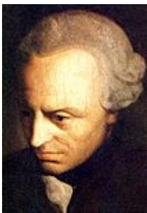
Immanuel Kant (1724 – 1804)

Immanuel Kant [28] samdi rit sitt Gagnrýni hreinnar skynsemi ( Kritik der reinen Vernunft ) (1781, 2. útg. 1787) til þess að reyna að setta raunhyggju og rökhyggju og veita nýjan grundvöll til rannsókna í frumspeki. Sjálfur sagði Kant að rit Humes hefði vakið sig af kreddublundi. Ætlun Kants með þessu verki var að líta á hvað við vitum og íhuga síðan hvað hlyti að vera satt um hvernig við vitum það. Stór hluti þessa verkefnis fólst í að afhjúpa takmörk mannglegrar þekkingar. Kant tók Evklíð sér til fyrirmyndar en játaði að endingu að hrein skynsemi nægði ekki til að uppgötva öll sannindi. Johann Gottlieb Fichte , Friedrich Schelling og Arthur Schopenhauer héldu starfi Kants að einhverju leyti áfram.