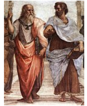
Skólinn í Aþenu eftir Rafael: Platon og Aristóteles

Platon var lærisveinn Sókratesar. [9] Hann fékkst við nánast öll svið heimspekinnar en frægust kenninga hans er sennilega frummyndakenningin . Platon taldi að efnisheimurinn væri hverful og léleg eftirlíking af fullkomnum heimi óhlutbundinna frummynda. Raunveruleg þekking hlyti að vera þekking á frummyndunum.