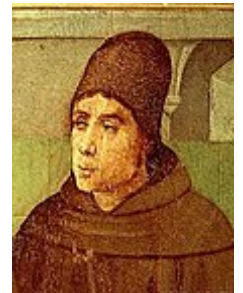
John Duns Scotus (um 1266 – 1308)

Á miðöldum varð til kristin skólaspeki , með höfundum á borð við Ágústínus kirkjuföður , Boethius , heilagan Anselm frá Kantaraborg , Robert Grosseteste , Albertus Magnus , Roger Bacon , Bonaventure , Thomas Aquinas , John Duns Scotus , William af Ockham , Nikulás af Cusa og Francisco Suárez . Heimspekingarnir í kristnu skólaspekihefðinni og heimspekingar innan annarra meginstrauma vestrænna trúarbragða, svo sem gyðinglegu heimspekingarnir Saadia Gaon og Maimonides , og íslömsku heimspekingarnir Avicenna , Al-Ghazali og Averroes áttu margvísleg samskipti. Þessar trúarhefðir fengust við spurningar um tengsl mannsins við guð.