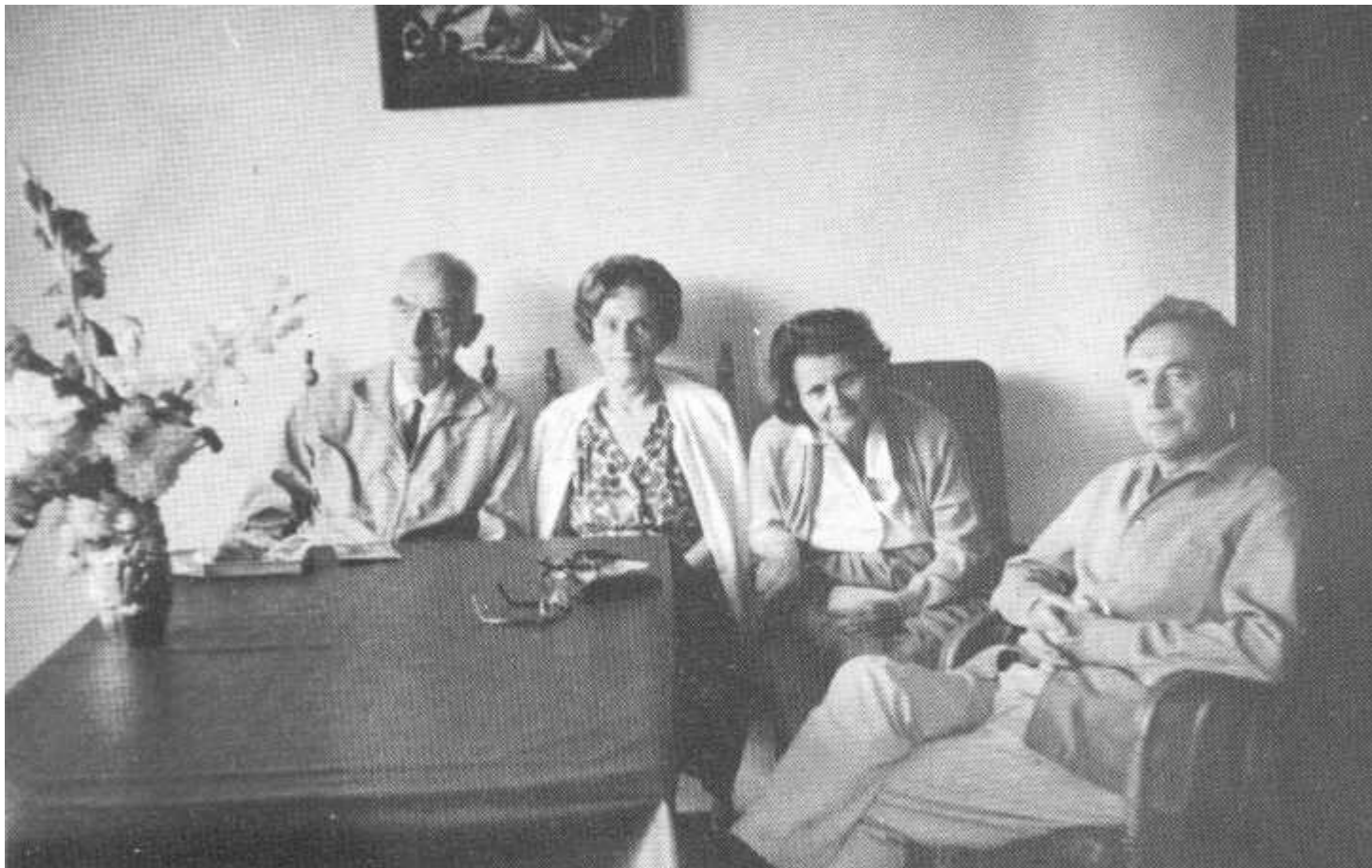
Anul 1967. Familia Sturdza reunită cu Comandantul și soția lui la Viladrau – Spania