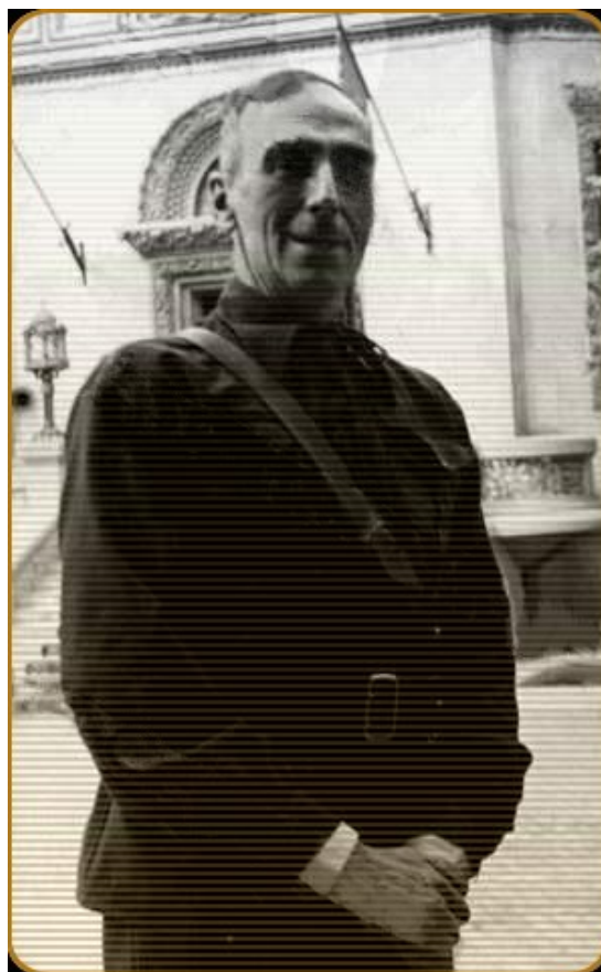
Mihail Sturdza, Ministru de Externe